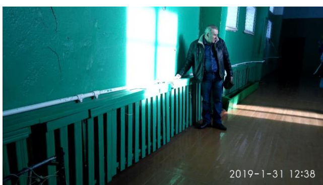
Прмерзание входной двери в спортзале школы