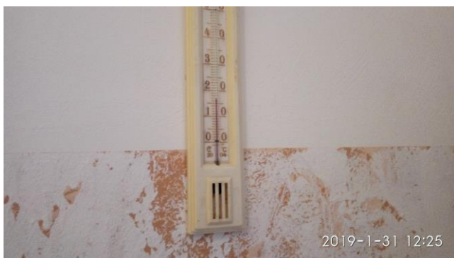
Спальная комната детского сада обгревается бытовыми нагревательными приборами