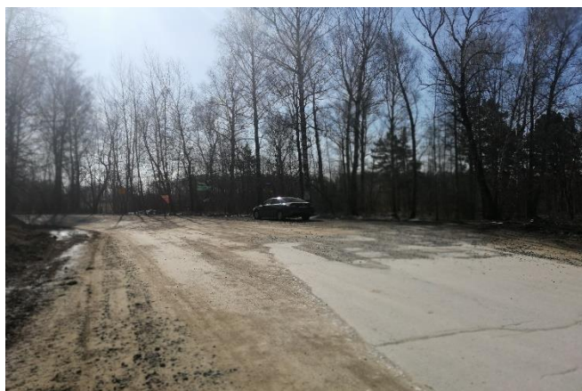
Участок дороги с щебеночным покрытием