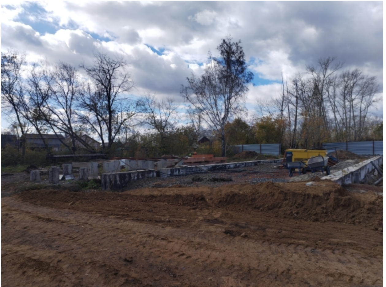
Наружные стены и перегородки прачечной