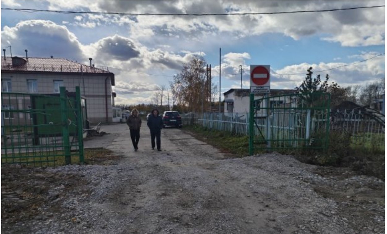
Парковка для посетителей