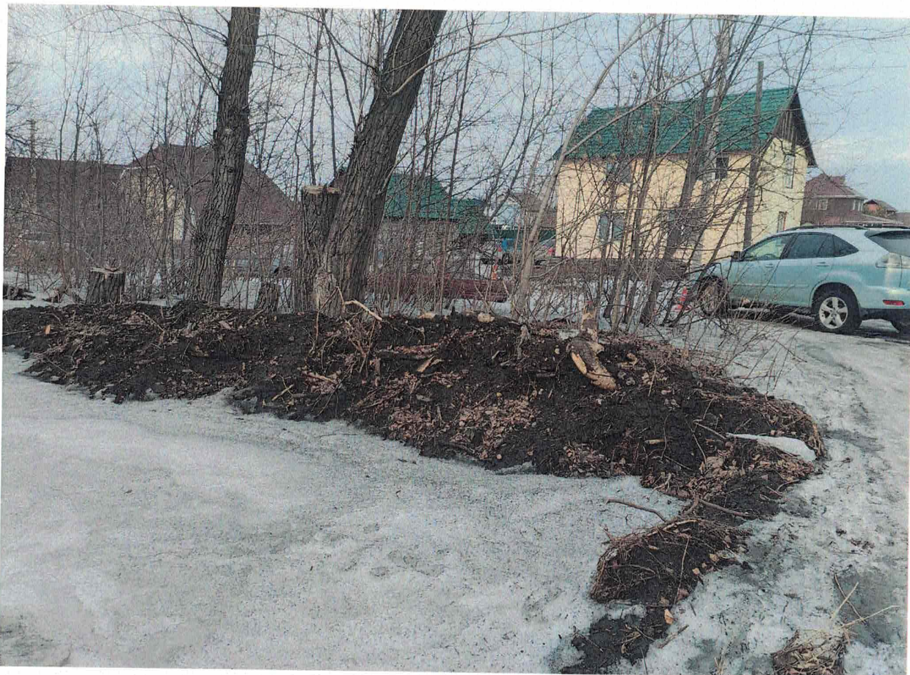
Ликвидированные несанкционированные свалки бытового и строительного мусора