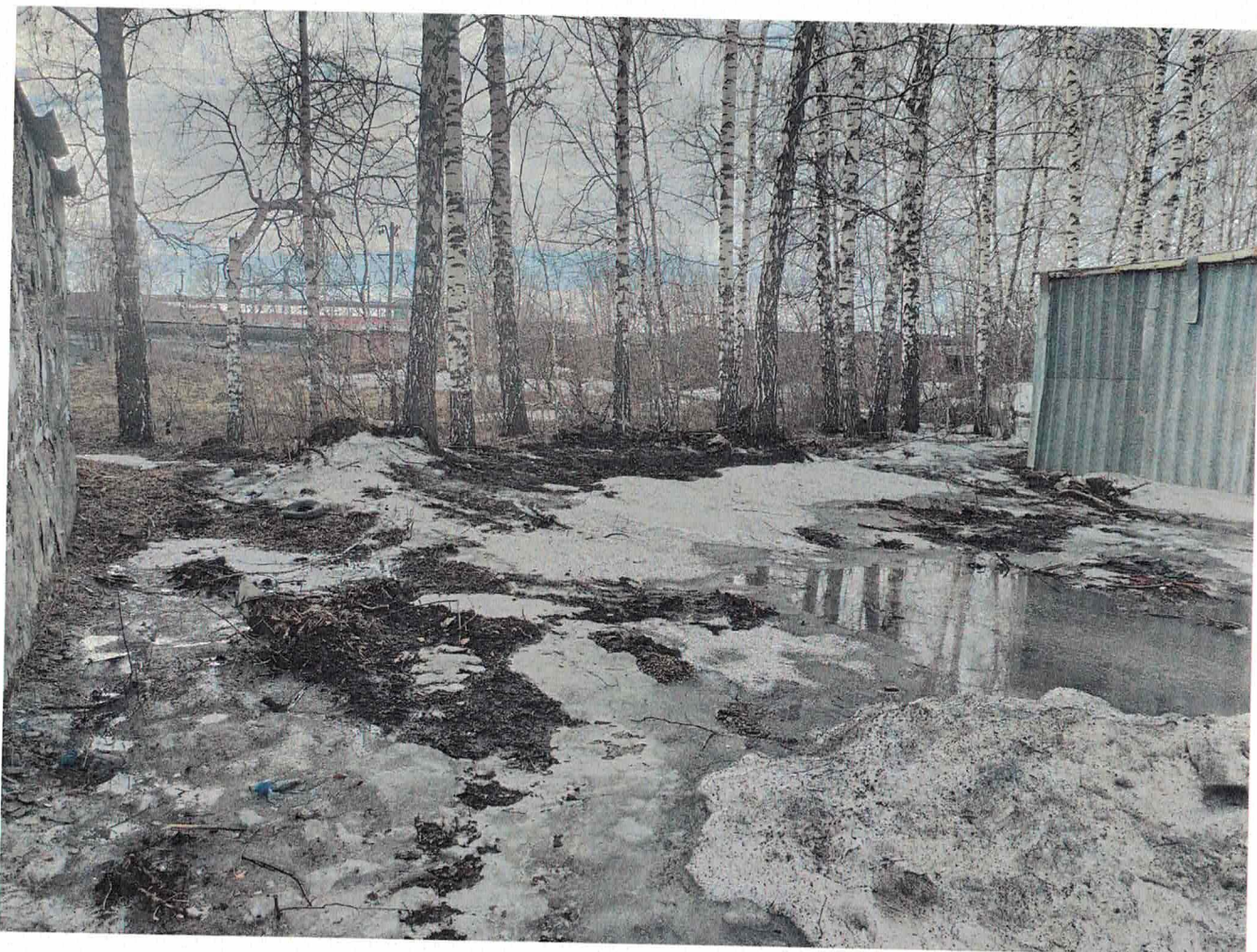
Запланированные к дополнительному кронированию тополя и территория для высадки дополнительных саженцев